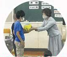
絵はがきコンクールに応募された小学校へドッジボールプレゼント