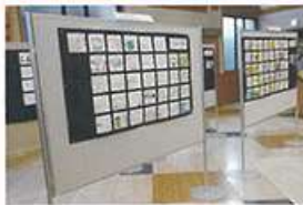
飯塚信用金庫本店及び5支店